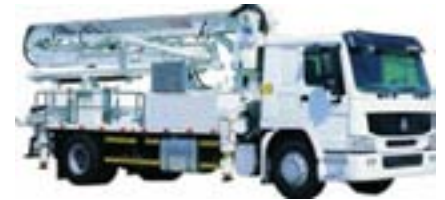
autopompe à béton

Voici certains des engins qui seront utilisés pour construire l'autoroute : chargeuses frontales/rétrocaveuses, bouteurs, excavateurs, sonnettes, camions à benne 3 essieux, grues, marteaux de démolition, rouleaux, niveleuses et autopompes à béton.