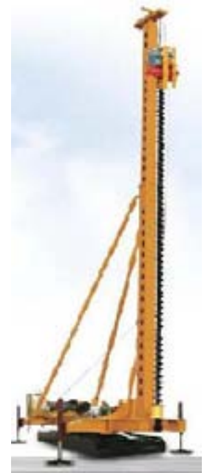
sonnette de battage

Pour l'autoroute, 3,9 millions mètres cubes de terre et de déblai seront enlevés pour construire la chaussée abaissée. Ce déblai sera enlevé par des bouteurs et des excavatrices, et transporté à un site spécifique par des camions à benne.